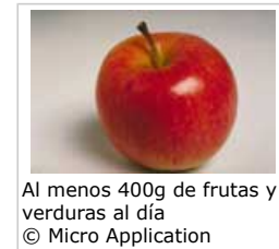
Al menos 400g de frutas y verduras al día

4.1 No se ha establecido ningún aporte nutricional específico para prevenir las enfermedades crónicas. Sin embargo, sí que existe un margen que se considera seguro y compatible con el mantenimiento de la salud de una población.