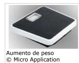
Aumento de peso

El aumento de peso puede deberse a cambios en la alimentación o la actividad física, y puede conducir a la obesidad y a otras enfermedades crónicas.