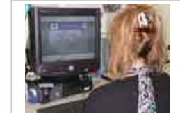
Static electric fields of screens

Sin embargo, las pantallas de cristal líquido que se utilizan en algunas computadoras portátiles y de escritorio no generan campos eléctricos y magnéticos significativos. Las computadoras modernas tienen pantallas conductoras que reducen el campo estático de la pantalla hasta un nivel similar al normal de fondo de los hogares o los lugares de trabajo.