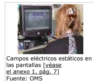
Campos eléctricos estáticos en las pantallas [véase el anexo 1, pág. 7]

La fricción, por ejemplo la producida al caminar sobre una alfombra, puede generar intensos campos eléctricos estáticos y provocar chispas.