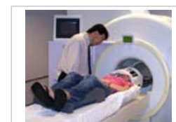
Escáner IRM

Se utilizan en investigación y en equipos médicos de obtención de imágenes de resonancia magnética (IRM), que proporcionan imágenes en tres dimensiones del cerebro y de otros tejidos blandos. Los pacientes sometidos al escáner y el personal que maneja el equipo pueden verse expuestos a campos magnéticos de gran intensidad.