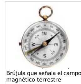
Brújula que señala el campo magnético terrestre

Estos campos estáticos son diferentes a los que proceden de campos que cambian con el tiempo, como los generados por aparatos que utilizan corriente alterna (CA), teléfonos móviles, etc.