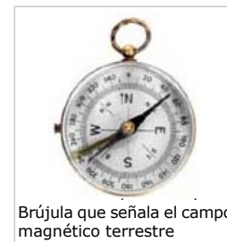
Brújula que señala el campo magnético terrestre

Estos campos estáticos son diferentes a los que proceden de campos que cambian con el tiempo, como los generados por aparatos que utilizan corriente alterna (CA), teléfonos móviles, etc.