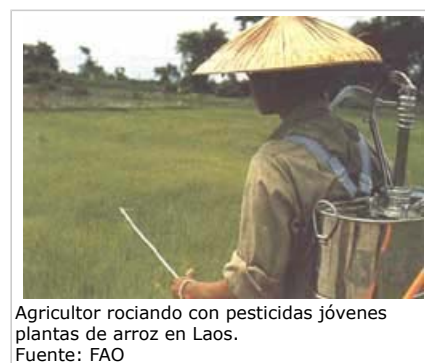
Agricultor rociando con pesticidas jóvenes plantas de arroz en Laos.

Los cultivos modificados genéticamente pueden tener efectos ambientales indirectos como resultado de cambios en las prácticas agrícolas y ambientales asociadas a las nuevas variedades.