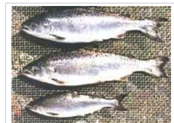
La ingeniería genética puede acelerar el crecimiento del salmón.

Hasta 2004, en la agricultura comercial no se han utilizados animales modificados genéticamente en ninguna parte del mundo. Sin embargo, se está estudiando la posibilidad de una transferencia de rasgos modificados genéticamente a varias especies ganaderas y acuáticas.