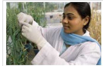
Investigación sobre el trigo del Indian Agricultural Research Institute.

2.4.1 Los jardineros crean nuevas plantas de forma rutinaria simplemente plantando esquejes de las que ya existen. La micropropagación, que consiste en crear plantas tomando pequeñas secciones de plantas y cultivarlas en tubos de ensayo, es simplemente una variante más sofisticada y eficaz de esta técnica.