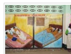
Fresco promoviendo el uso de mosquiteros [véase el anexo 1, pág. 6]

6.2 En la región de África de la OMS , el número de casos y muertes por paludismo registrado fue más del doble entre 2001 y 2006, lo que se traduce o bien en una mejora de la vigilancia o en la realización de informes más completos en los últimos años. Además, como las campañas de control en la mayoría de países africanos sólo cubrían una pequeña parte de la población en 2006, aún no se espera que el número de casos de paludismo y de defunciones causadas por la enfermedad en la región se reduzca por completo.