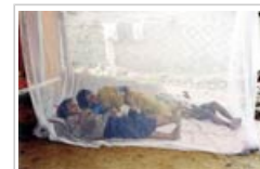
Los mosquiteros constituyen una medida de protección importante

En primer lugar, las personas deberían dormir bajo mosquiteros tratados con insecticidas de larga duración. Esto permite evitar las picadas de mosquitos infectados por paludismo y al mismo tiempo eliminarlos. Las mujeres embarazadas y los niños menores de cinco años deberían utilizar estos mosquiteros como una prioridad, pues son los más vulnerables.