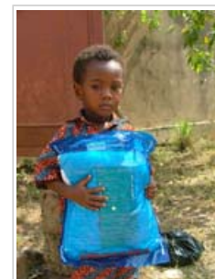
Niño con un mosquitero en Togo. En muchos países se requieren más mosquiteros

4.2 Respecto a la prevención del paludismo , a pesar del gran incremento en el suministro de mosquiteros durante los últimos años, especialmente a mujeres embarazadas y a niños, la mayoría de los países no disponen de suficientes mosquiteros. La segunda medida de prevención fundamental, que consiste en el rociamiento de interiores con insecticidas, suele utilizarse en zonas específicas donde haya más riesgo. Sin embargo, sólo en unos pocos países protege este método a una proporción importante de la población.