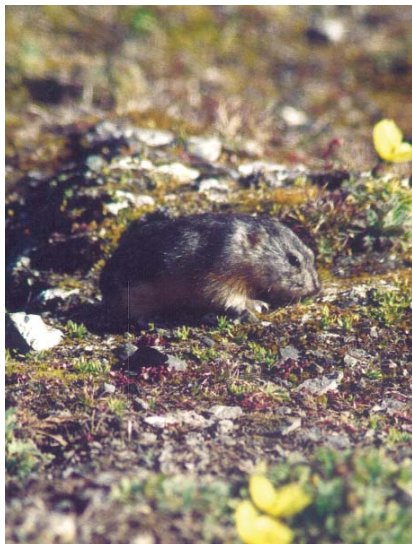
L'Arctique abrite toute une série de plantes et d'animaux, et près de quatre millions de personnes.

Ces projections ont été élaborées sur la base d'un scénario de réchauffement climatique graduel. Toutefois, des changements brusques et inattendus ne sont pas à exclure.