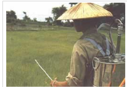
Agriculteur aspergeant de pesticide des jeunes plants de riz au Laos.

Les cultures génétiquement modifiées peuvent avoir des effets indirects sur l'environnement suite aux changements dans les pratiques agricoles ou environnementales liées aux nouvelles variétés.