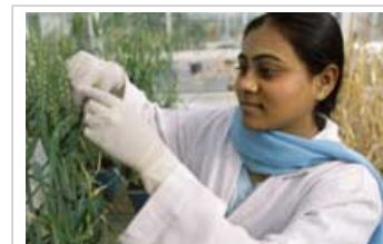
Recherche sur le blé (Indian Agricultural Research Institute)

2.4.1 Les jardiniers créent couramment de nouvelles plantes simplement en plantant des boutures de plantes existantes. La micropropagation, qui crée des plantes à partir de petits échantillons de plantes cultivés dans des éprouvettes, est simplement une variante plus sophistiquée et efficace de cette technique.