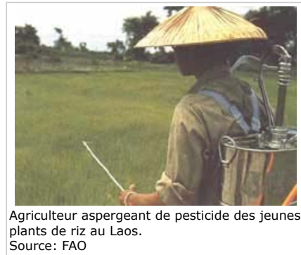
Agriculteur aspergeant de pesticide des jeunes plants de riz au Laos.

Les cultures génétiquement modifiées peuvent avoir des effets indirects sur l'environnement suite aux changements dans les pratiques agricoles ou environnementales liées aux nouvelles variétés.