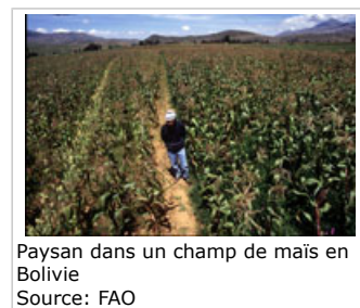
Paysan dans un champ de maïs en Bolivie

Le génie génétique peut accélérer les dommages causés par l'agriculture, avoir le même impact que l'agriculture conventionnelle, ou contribuer à des pratiques agricoles plus durables et à la conservation des ressources naturelles, y compris la biodiversité.