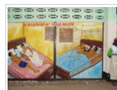
Campagne om het gebruik van muggennetten te promoten [zie Annex 1, p.6]

6.2 In de Afrikaanse WGO-regio was er tussen 2001 en 2006 meer dan een verdubbeling van het aantal gemelde malariagevallen en -doden. Dit wijst ofwel op een verbetering van de monitoring ofwel op meer volledige rapporten met betrekking tot de recente jaren. Bovendien is het zo dat, aangezien campagnes voor de beheersing van malaria in de meeste Afrikaanse landen nog maar een klein deel van de bevolking bereikt hadden tegen 2006, een algemene afname van het aantal malariagevallen en -doden in de regio nog niet verwacht wordt.