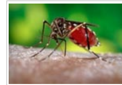
Anophelesmug, de overdrager van malaria.

Malaria is één van de meest voorkomende infectieziekten en vormt wereldwijd een ernstig probleem voor de volksgezondheid, vooral in Afrika en in het zuiden van Azië. De ziekte wordt veroorzaakt door een microscopisch kleine parasiet die door muggenbeten wordt overgedragen. Enkel bepaalde soorten muggen van het Anopheles geslacht – en enkel de vrouwtjes van die soorten – kunnen malaria overdragen.