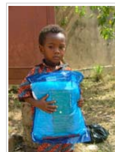
Kind met muggennet in Togo. Er zijn in veel landen nog altijd te weinig netten.

4.2 Wat de malariapreventie betreft, is het zo dat ondanks grote uitbreidingen van de bevoorrading van muggennetten in de voorbije jaren, in het bijzonder naar zwangere vrouwen en kinderen toe, het aantal beschikbare netten nog altijd ruimschoots onvoldoende is in de meeste landen. De andere belangrijkste preventieve maatregel, namelijk de binnenmuren van huizen besproeien met insecticide, wordt typisch gebruikt in specifieke gebieden waar het risico het grootst is. Enkel in een klein aantal landen beschermt die methode een betekenisvol aandeel van de bevolking.