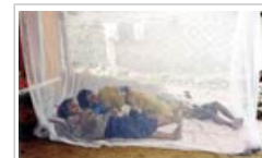
Muggennetten zijn een belangrijke preventieve maatregel.

Eerst en vooral zouden mensen moeten slapen onder muggennetten die behandeld werden met lang werkende insecticiden. Dit voorkomt beten van muggen die met malaria besmet zijn en doodt die muggen. Zulke netten zouden in de eerste plaats door zwangere vrouwen en kinderen jonger dan vijf jaar, die het kwetsbaarst zijn, gebruikt moeten worden.