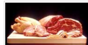
Die Nachfrage nach Tierprodukten wie Fleisch steigt

Weltweit findet ein Ernährungswechsel statt. Traditionelle pflanzliche Nahrungsmittel wie Getreide und Kartoffeln werden mehr und mehr durch Nahrungsmittel mit zugesetztem Zucker und tierischen Fetten ersetzt. In Verbindung mit einem allgemeinen Trend zu einer zunehmend sitzenden Lebensweise ist dies ein Risikofaktor, der der Entwicklung von chronischen Krankheiten zugrunde liegt.