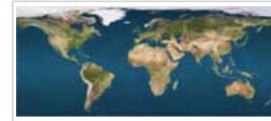
Chronische Krankheiten nehmen weltweit zu

1.1 Chronische Krankheiten sind lang andauernde Krankheiten, die nicht ansteckend und weitgehend vermeidbar sind. Sie sind weltweit die häufigste Todesursache und stellen eine erhebliche Belastung für die Gesellschaft dar. Dies gilt insbesondere für Krankheiten wie Fettleibigkeit, Diabetes, Herz-Kreislauf-Erkrankungen, Krebs, Zahnerkrankungen und Osteoporose. Eine bessere Ernährungsweise und mehr Bewegung können das Risiko für diese chronischen Krankheiten verringern.