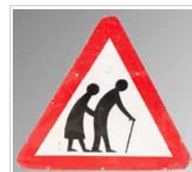
Das Osteoporoserisiko steigt mit dem Alter

10.1 Die Krankheit Osteoporose betrifft Millionen von Menschen auf der ganzen Welt. Sie führt zu erhöhter Knochenbrüchigkeit, Fragilität und folglich zu einem steigenden Risiko für Knochenbrüche. Das Risiko, Osteoporose zu entwickeln, steigt mit dem Alter und kann zu Krankheit, Behinderung und sogar zu vorzeitigem Tode führen.