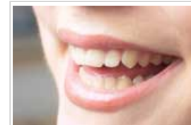
Ernährung spielt bei Zahnerkrankungen eine wichtige Rolle

9.1 Zahnerkrankungen wie Karies und Zahnfleischerkrankungen verursachen hohe Kosten für die Gesundheitssysteme. Zwar ist die Zahl der Kariesfälle in den letzten 30 Jahren zurückgegangen, jedoch hat sich die Lebenserwartung verlängert, sodass die Zahl der Menschen mit Zahnerkrankungen zunimmt. Dies ist insbesondere in Ländern mit steigendem Zuckerkonsum und unzureichender Fluoridversorgung der Fall.