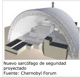
Nuevo sarcófago de seguridad proyectado

4.2 El año del accidente se construyó un sarcófago para sellar el reactor estropeado. Éste tiene algunos defectos debido a que fue construido de una manera apresurada y en condiciones muy adversas, ya que el personal que trabajó en su construcción estuvo expuesto a niveles de radiación muy altos.