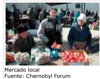
Mercado local

5.2 La agricultura fue el sector económico más afectado por las consecuencias del accidente. Además, quedó gravemente afectada por la agitación económica de los años 90. Para mejorar la economía de la región es necesario hacer frente no sólo a la contaminación, sino también a los problemas socio-económicos generales que pesan sobre muchas zonas agrícolas.