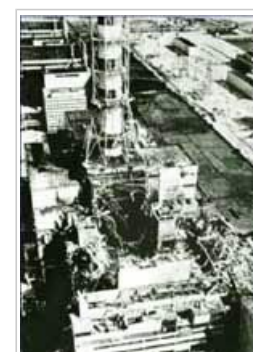
El reactor destruido

El de Chernóbil es el accidente más grave de todos los acontecidos en la historia de la industria nuclear. De hecho, la explosión que se produjo el 26 de abril de 1986 en uno de los reactores de la central nuclear y los fuegos que se derivaron de ésta y que se prolongaron durante diez días provocaron la liberación al medio ambiente de enormes cantidades de material radiactivo y la formación de una nube radiactiva que se extendió por buena parte de Europa. La contaminación más grave se produjo en las regiones que rodean al reactor y que en la actualidad forman parte de Bielorrusia, Rusia y Ucrania.