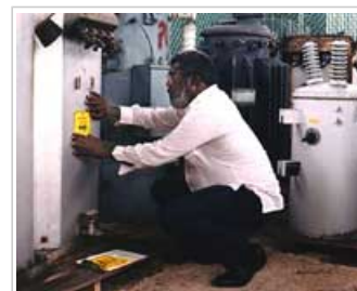
Etiquetaje de un transformador con PCB

1.1 Los PCB se utilizan en una amplia gama de productos, como aparatos eléctricos, revestimientos de superficies, tintas, adhesivos, pirorretardantes y pinturas. Los PCB pueden liberarse al medio ambiente, por ejemplo, al incinerar o almacenar en vertederos residuos que los contienen. Cerca del 10% de los PCB fabricados desde 1929 siguen presentes en el medio ambiente. Hoy en día, la fabricación y utilización de PCB está prohibida o sometida a restricciones importantes en muchos países, debido a su posible impacto sobre la salud y el medio ambiente.