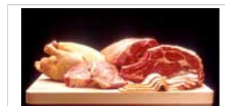
Una vía de exposición humana es el consumo de alimentos contaminados, especialmente carne, pescado y aves de corral

3.1 La principal vía de exposición humana es el consumo de alimentos contaminados, especialmente carne, pescado y aves de corral. La ingesta de PCB entre los adultos alcanzó su valor máximo a finales de los setenta, pero descendió hasta niveles más bajos en los noventa.