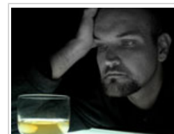
Los adictos al alcohol, el tabaco o la cocaína son más propensos a sufrir depresión que quienes no padecen una adicción.

Asimismo, los drogodependientes son más propensos a padecer enfermedades mentales que el resto de la población. Así, por ejemplo, los adictos al alcohol, el tabaco o la cocaína son más propensos a sufrir depresión que quienes no padecen una adicción.