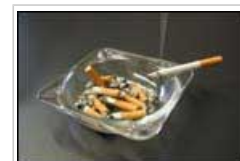
Véase también nuestro dossier sobre Tabaco [véase https://www.greenfacts.org/es/tabaco/index.htm ]

2.2 El consumo de sustancias psicoactivas, ya sea por placer o para aliviar el dolor, puede dañar la salud y acarrear problemas sociales a corto y largo plazo. Los efectos sobre la salud pueden consistir en enfermedades del hígado o del pulmón, cáncer, lesiones o muertes provocadas por accidentes, sobredosis, suicidio y agresiones. Algunos ejemplos de los efectos en el plano social son las detenciones, la pérdida de las relaciones y el descuido de las obligaciones laborales y familiares.