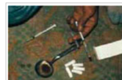
La drogadicción puede considerarse un proceso de aprendizaje.

4.1 La drogadicción puede considerarse un proceso de aprendizaje. Una persona consume una droga y experimenta su efecto psicoactivo, que resulta muy gratificante o reafirmante, y que activa circuitos cerebrales que aumentan la probabilidad de que la persona repita esta conducta. El cerebro reacciona como si consumir la droga fuera importante para la supervivencia.