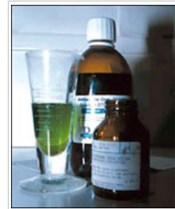
La metadona es un medicamento utilizado como sustituto para la heroína.

6.3 Los rápidos avances en nuestro conocimiento sobre el funcionamiento del cerebro dan lugar a un amplio abanico de nuevas cuestiones éticas sobre la investigación y el tratamiento de la drogodependencia. La investigación biomédica se guía por principios morales como garantizar que los beneficios para la sociedad sean superiores a los riesgos para quienes acceden a recibir un tratamiento o a participar en los experimentos. Las cuestiones éticas que deben tenerse en cuenta son la igualdad de acceso al tratamiento, la posibilidad de tratar a una persona sin su consentimiento, la financiación pública del tratamiento de dependencia, la credibilidad pública de los ensayos clínicos y las cuestiones morales derivadas de los experimentos con animales y la detección genética.