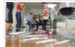
El alcohol y la cocaína son ejemplos de sustancias psicoactivas.

Las sustancias psicoactivas son aquellas cuyo consumo puede alterar los estados de conciencia, de ánimo y de pensamiento. Son sustancias psicoactivas, por ejemplo, el tabaco, el alcohol, el cannabis, las anfetaminas, el éxtasis, la cocaína y la heroína.