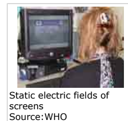
Static electric fields of screens

Toutefois, les écrans à cristaux liquides qui équipent certains ordinateurs portables ou ordinateurs de bureau ne produisent pas de champs électriques ou magnétiques importants. Les ordinateurs modernes sont dotés d'écrans conducteurs qui réduisent le champ électrostatique à une valeur proche de celle du champ de fond qui règne normalement dans la maison ou sur le lieu de travail.