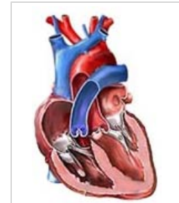
Les champs magnétiques statiques pourraient générer des courants électriques autour du coeur

4.2 Les interactions entre les tissus biologiques et un champ statique magnétique dépendent des propriétés physiques du champ, telles que l'intensité et la direction du champ à un endroit donné dans le corps. Les interactions qui peuvent avoir les conséquences les plus lourdes pour la santé se produisent lorsqu'il y a du mouvement dans le champ suite au déplacement du corps ou à la circulation du sang.