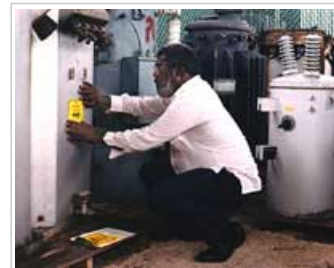
Etiquetage d'un transformateur contenant des PCB

1.1 Les PCB sont utilisés dans de nombreux produits, notamment le matériel électrique, les revêtements de surface, les encres, les adhésifs, les retardateurs de flamme et les peintures. Les PCB peuvent par exemple être rejetés dans l'environnement lors de l'incinération ou du stockage en décharge de déchets contenant ces substances. Environ 10% des PCB produits depuis 1929 sont toujours présents dans l'environnement à l'heure actuelle. Etant donné les possibles effets des PCB sur la santé et sur l'environnement, leur utilisation et leur production sont aujourd'hui sévèrement restreintes, voire interdites dans de nombreux pays.