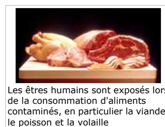
Les êtres humains sont exposés lors de la consommation d'aliments contaminés, en particulier la viande, le poisson et la volaille

3.1 Les êtres humains sont principalement exposés lors de la consommation d'aliments contaminés, en particulier la viande, le poisson et la volaille. L'apport en PCB provenant des aliments chez les adultes a atteint un pic à la fin des années 70 et a ensuite diminué pour atteindre un niveau plus bas dans les années 90.